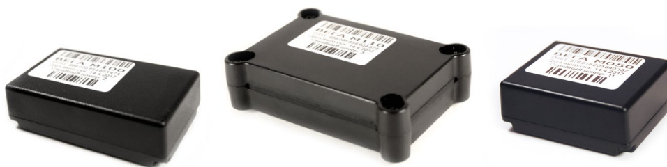
Рисунок 1 - Внешний вид поискового устройства Вега М100 (слева), Вега М110 (центр), Вега М50 (справа).

При использовании устройства с заводскими настройками продолжительность автономной работы может составлять до 2-х лет. В активном режиме поиска потребление энергии устройством увеличивается, так что продолжительность автономной работы сокращается до нескольких дней.